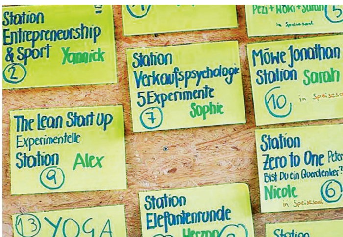
Gute Ideen sind gefragt: Welche ist geeignet, um ein ganzes Start-up-Unternehmen zu tragen?

Unternehmer sein ist aber alles andere als einfach: Viel Verantwortung ist nötig und man muss sich meist alleine durch schwierige Zeiten kämpfen. Ist man aber bereit, diese Hürden zu meistern, kann man schon sehr früh den Grundstein für eine erfolgreiche Unternehmerlaufbahn legen. JuRed